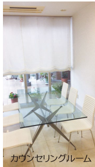
カウンセリングルーム