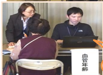
血管年齢 測定の様子