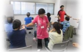
東区役所での活動の様子

介護予防サポーターに興味のある方は、ささえりあ桜木・秋津までお問い合わせください。 ☎360-5550