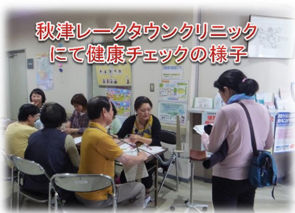
秋津レークタウンクリニック にて健康チェックの様子