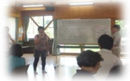
秋津校区体力測定の様子