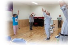
桜木東4・5町内 若桜会