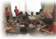
桜木東2町内 東桜会