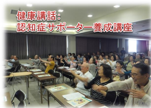
健康講話: 認知症サポーター養成講座