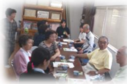
秋津レクワシ健康茶話会